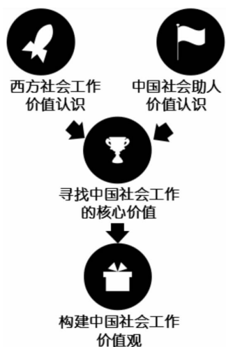
图5 中国社会工作价值观的构建

此时,需要考虑的基础因素主要来自两方面:其一,当前中国社会的助人价值认识;其二,西方社会工作的价值认识;如果想把这两方面的价值认识进行有效的结合与发展,就必须确立中国社会工作的核心价值,即中国社会工作所具有的,区别于其他社会工作或其他工作的,不可替代的,最基本、最持久的特质部分。它将与中国社会工作的使命相联系,成为中国社会工作者判断是非的标准和行为规范的准则。它是中国社会工作价值体系的核心部分;只有围绕这样的核心价值,我们方能从容构建中国社会工作的价值观。其原理过程见图5: