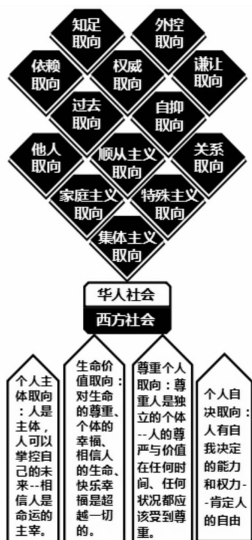
图3 中西方价值体系之比较

起来的,但‘福利社会’的基础则是人有至高无上的尊严,并必须发展潜能以肯定自我的存在。以中国文化而言,人却永远不是独立的个体”。“在现代社会,对人的地位和身份的看法,有了极大的变化,个人的独立性也较以前增强。但无可否认,在中国人的社会,人总被看为家庭成员之一,或工作单位的一分子,很难与西方社会的个人意识比较。因此,在深受中国文化影响的社会里,一般人对社会工作者宣扬的信念,仍不能无条件的接受。” [14]11 或简言之,周永新将“对人的归属认识”作为了中国文化与社会工作价值观之间矛盾的焦点,举证情况参见图4 [14]12 。其中,“社会工作对人所持的观念”证据来自毕仁(Butrym),该学者指出,西方社会工作的哲学思想主要源自三个假设:“第一是对人的尊重;第二是相信人有独特的个性;第三是坚守人有自我改变、成长和不断进步的能力。” [14]8 而“传统中国文化对人的看法”证据来自中国学者对中国传统文化的总结,主要观点是“权利因亲疏而有分别”“人依附不同组织生存”“进步是整体的成就”等等。