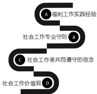
图2 社会工作价值观的形成

不同人群、学科,对“价值”一词的认识不尽相同。一般来讲,价值是人们对善恶美丑的判断。而价值观,“是价值的系统化,是概括性的、对期望事物带有情感色彩、有历史起源与经验基础、被一群体共同认定同时也模塑群体的行为规范。” [13] 社会工作价值观的最早形成,与一些思想家宣扬的道理并没有直接关系,而是一群默默耕耘的福利工作者的实践成果。“工业革命自十九世纪初开展后,随即给欧美各国带来巨变,社会服务亦应需要产生。当时从事福利工作的同工 ① ,把他们积累下来的工作经验不断整理,日后逐渐成为社会工作者的专业守则,也就是社会工作者共同遵守的信念” [14]5 ;这些信念在经历抽象化、理论化等过程之后,形成社会工作价值观。过程见图2: